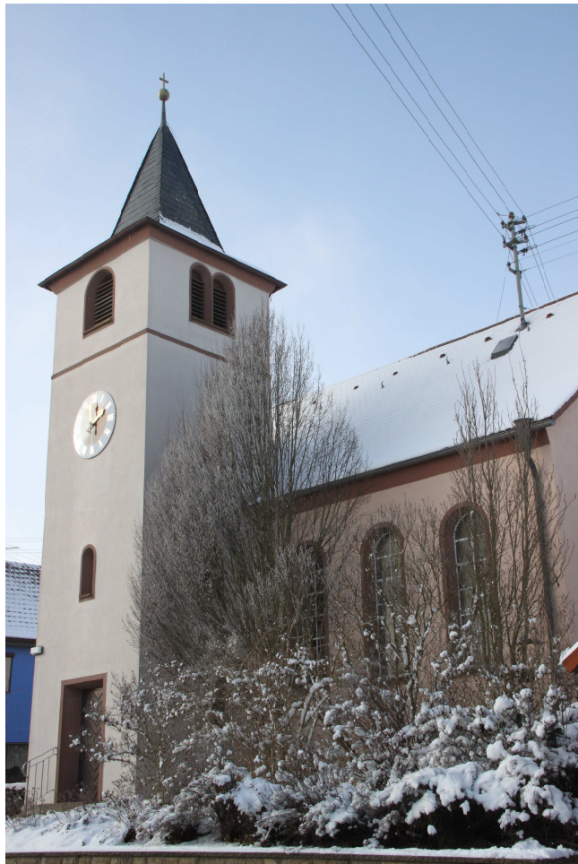
Ev. Kirche Windischbuch

Herausgeber und verantwortlich für den amtlichen Teil: Stadtverwaltung 97944 Boxberg, Tel. 07930/605-0